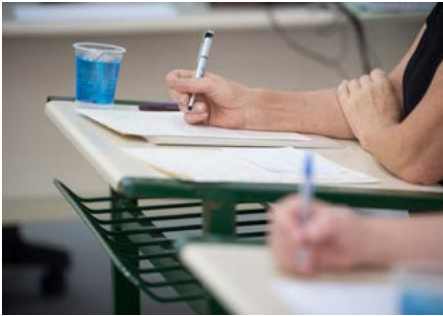
Oficina com Lubi Prates