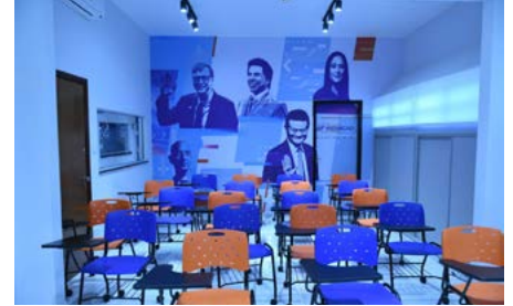
Sala para cursos