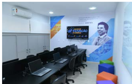
Sala para iniciação científica e startups