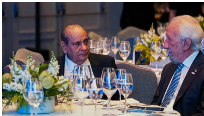
O presidente do Sistema CNC-Sesc-Senac, José Roberto Tadros, e o presidente do Sistema Fecomércio Sesc Senac PR e vice-governador do Paraná, Darci Piana

Em uma noite de reconhecimento e celebração no Palácio Tangará, em São Paulo, o Prêmio Atena 2023/2024 homenageou federações e sindicatos do Sistema Comércio, ao reconhecer o esforço de lideranças e entidades pelo melhoramento contínuo, inovação e fortalecimento institucional. O evento realizado na noite de 24 de novembro ressaltou o impacto transformador do Programa Atena, iniciativa da Confederação Nacional do Comércio de Bens, Serviços e Turismo (CNC) para desenvolver as entidades sindicais do Sistema Comércio.