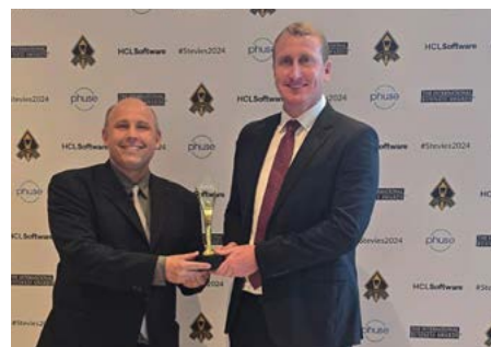
Banco de Alimentos Comida Boa da Ceasa conquista prêmio internacional na Turquia

Criado em 2020 para enfrentar a crise alimentar durante a pandemia, o Comida Boa opera em várias regiões do estado e conta com o apoio do Departamento de Polícia Penal do Paraná, que envolve detentos no processamento dos alimentos. O programa também destina cerca de 29 toneladas mensais de alimentos para criadouros