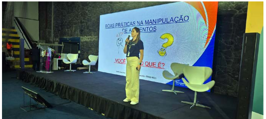
Palestra sobre Boas Práticas na Manipulação de Alimentos, oferecida pelo Senac

turista. “Cada vez que vamos nos alimentar na praia, sempre esperamos a qualidade no atendimento com a higiene necessária. Desejamos que cada um venda muito nessa temporada. Temos cada vez mais prazer em vir pra cá, principalmente pelo acolhimento que vocês dão a todos os turistas. Lembramos que o Senac tem cursos gratuitos durante todo o