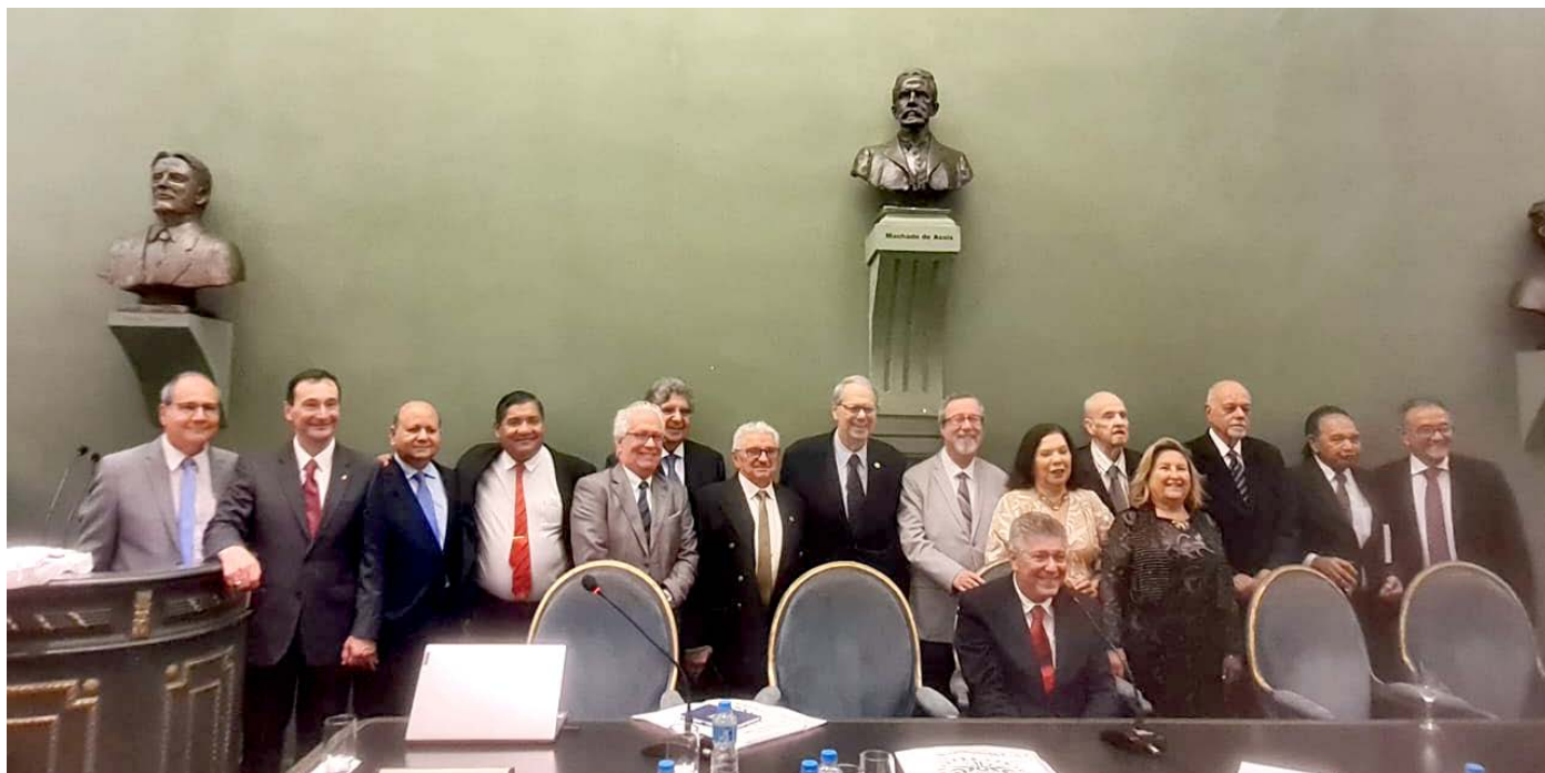
Membros da primeira Diretoria do Fórum das Academias Estaduais de Letras

A primeira Diretoria do Fórum das Academias Estaduais de Letras (FAEL) tomou posse na noite desta segunda-feira (14/10), no Salão Nobre, no Petit Trianon da Academia Brasileira de Letras (ABL), no Rio de Janeiro.