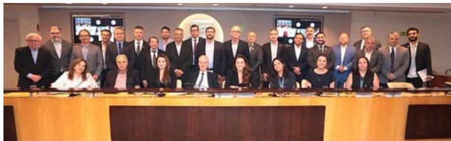
Membros da Câmara

Atualizações sobre o status das proposições em andamento pelas Assessorias Técnicas da CNC foram