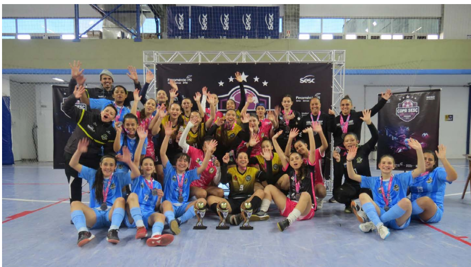
Os três primeiros lugares da fase municipal realizada no Sesc da Esquina

Os vencedores municipais se encontrarão em Curitiba para a fase fi-