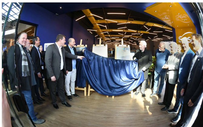
Autoridades e membros da Comissão de Obra durante a cerimônia de inauguração

O Sistema Fecomércio Sesc Senac PR deu mais um passo no seu plano de expansão, ao inaugurar ontem (29) novas instalações no City Center Outlet Premium, em Campo Largo. As unidades vão oferecer ampla gama de serviços, trazendo inovação, qualidade e diversos benefícios para a população da cidade e de seu entorno, incluindo academia do Sesc e café-escola do Senac.