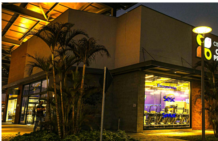
Novas instalações do Sesc e do Senac em Campo Largo