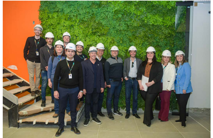
Equipes do Sesc e do Senac PR em vistoria à obra da nova unidade, que será inaugurada em breve

Nesta quarta-feira (24) representantes do Sistema Fecomércio Sesc Senac PR estiveram no City Center Outlet Premium, em Campo Largo, para a entrega das chaves da Unidade Móvel de Moda e Beleza.