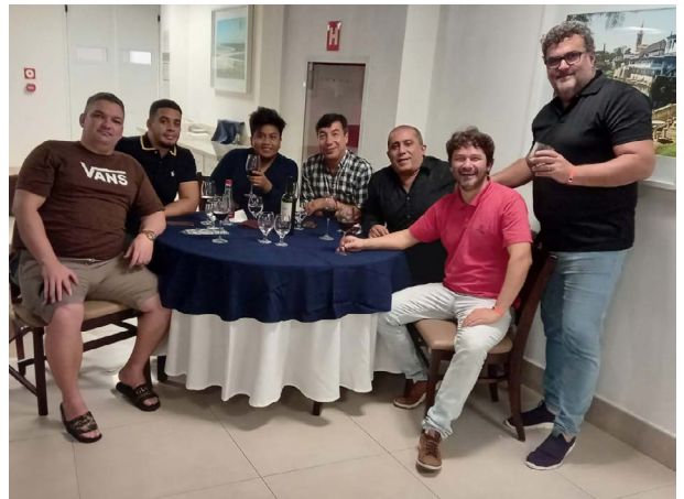
Jantar dos Mestres

Esta edição contou com a participação de mais de 200 enxadristas em cada competição, sendo dezenas com titulações da Federação Internacional de Xadrez (FIDE). Além do Brasil, participaram atletas de mais nove países estrangeiros entre eles dos Estados Unidos da América, México, Peru, Colômbia, Argentina e Paraguai.