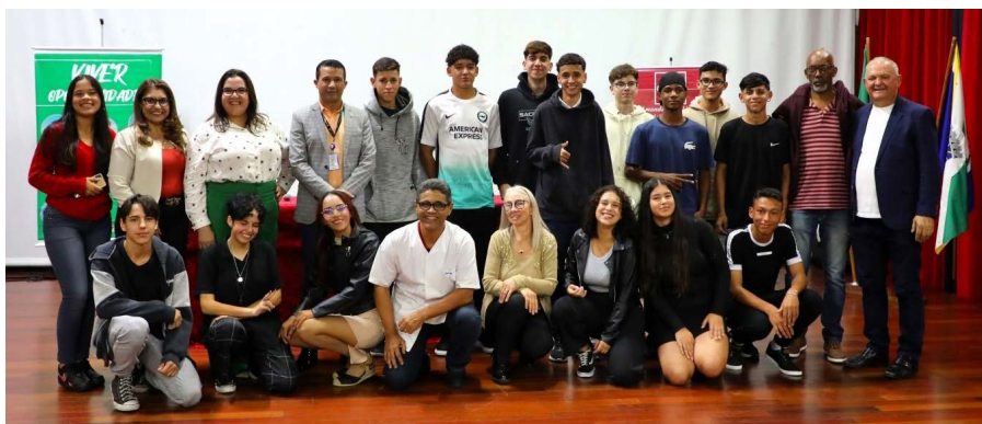
Formandos o programa Viver Oportunidades

Informações e fotos: Prefeitura de Pinhais