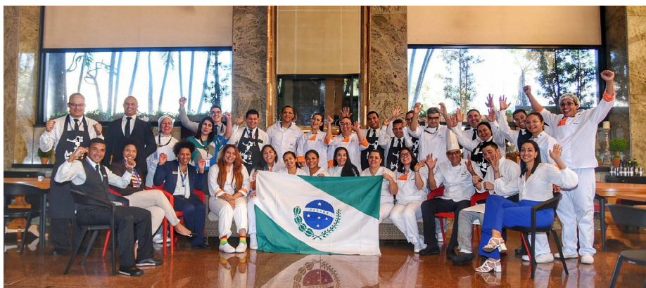
Equipes do Senac PR e do Departamento Nacional do Senac

Mais de 100 clientes experimentaram os pratos especiais da culinária paranaense servidos no menu. Como welcome drink , chá mate de São Mateus do Sul e gengibirra caseira; de couvert, Chancliche caseiro e homus de pinhão com pão sírio; a entrada foi Pão no bafo de Palmeira; como prato principal, suíno laqueado com goiabada de Carlópolis acompanhado de batata fondant e vagem na manteiga de gengibre; para finalizar, como so-