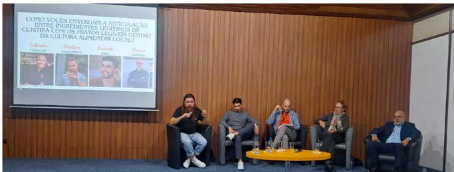
Mesa redonda sobre a Cultura Alimentar: produtos, pratos e ingredientes