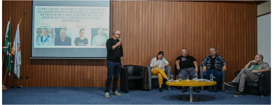
Mesa redonda sobre Cenário atual da gastronomia de Curitiba