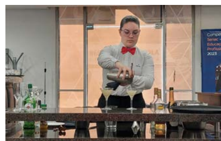
Ocupação Serviço de Restaurante

o DR Paraná. Poder estar perto das unidades e enxergar o que podemos melhorar é fundamental para melhorarmos o processo. A função do ex-