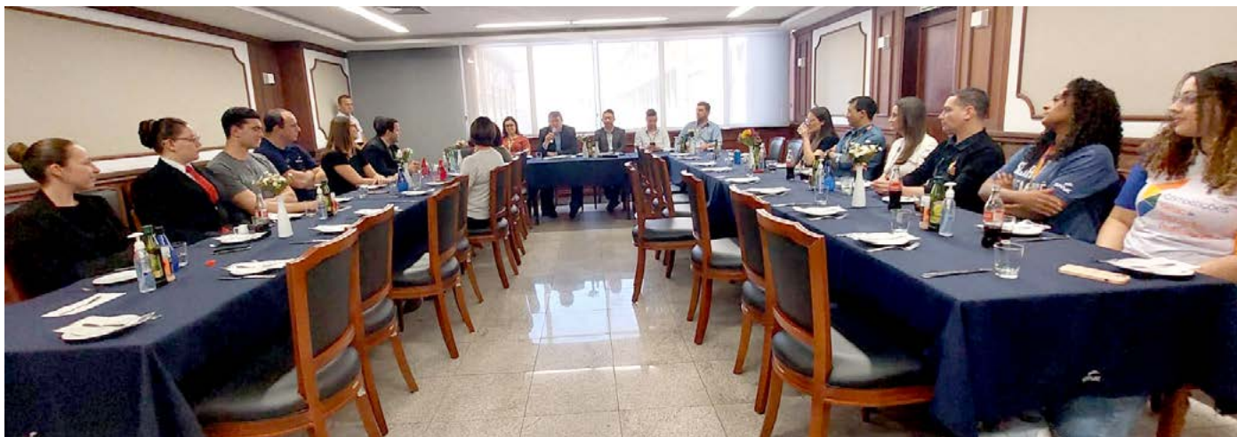
Diretoria do Senac PR recebe experts em almoço

Durante esta semana os quatro representantes do Senac PR nas Competições Senac de Educação Profissional estão participando de simulados com a presença dos experts das ocupações de Cozinha, Cabeleireiro, Serviços de Restaurante e Cuidados de Saúde e Apoio Social.