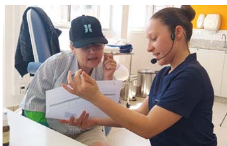
Ocupação Cuidados de Saúde e Apoio Social