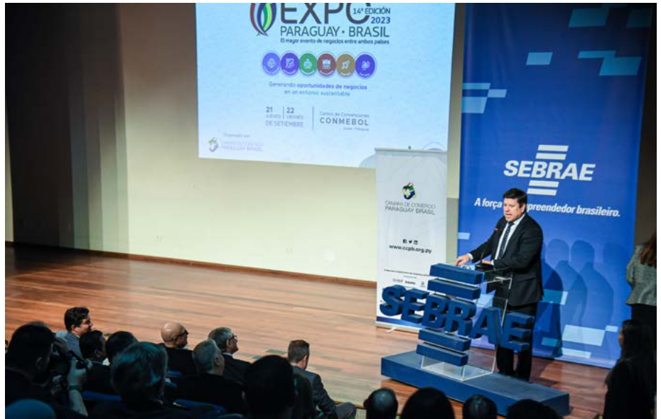
O ministro designado para o Ministério de Indústria e Comércio do Paraguai, Javier Jiménez García de Zuñiga Gimenez, durante abertura do encontro bilateral Paraguai-Paraná

Também participaram do encontro o cônsul-geral do Paraguai em