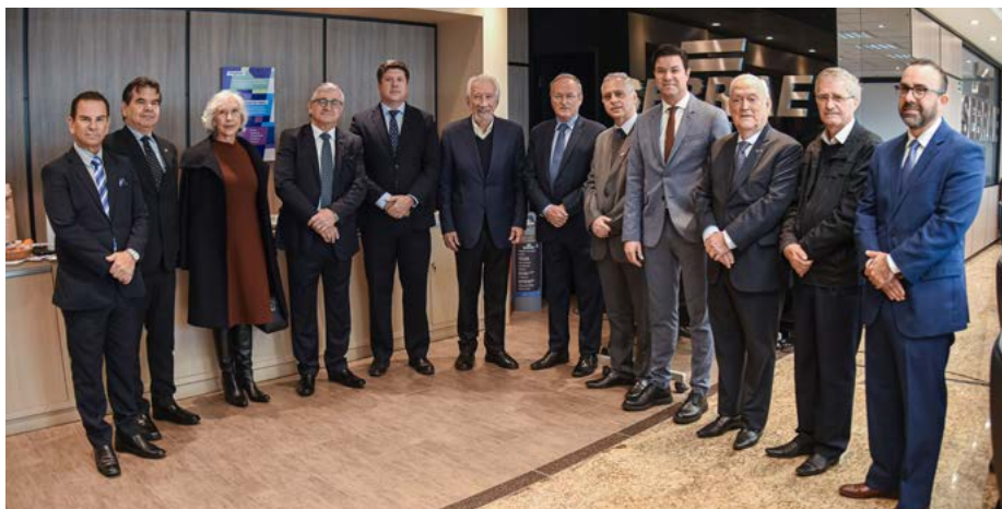
Autoridades paraguaias e paranaenses durante a conversa que antecedeu o encontro bilateral