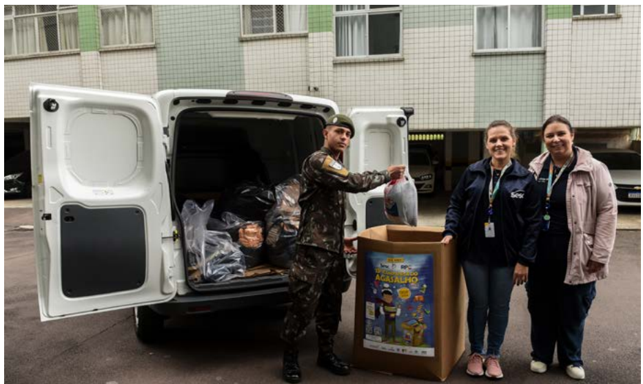
Mobilização no bairro Vila Izabel, em Curitiba