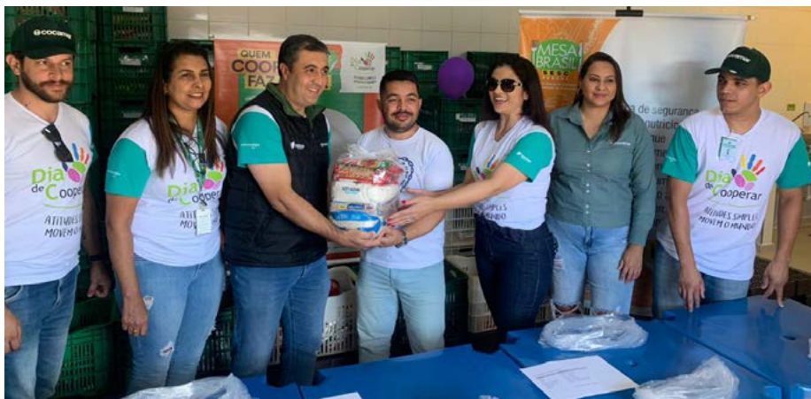
Dia C em Londrina

As doações serão repassadas às instituições sociais e famílias cadastradas no Programa Mesa Brasil das cidades de Curitiba, Londrina, Maringá e áreas de abrangência. O Programa segue complementando a alimentação das pessoas que vivem em situação de insegurança alimentar e vulnerabilidade social no Paraná.