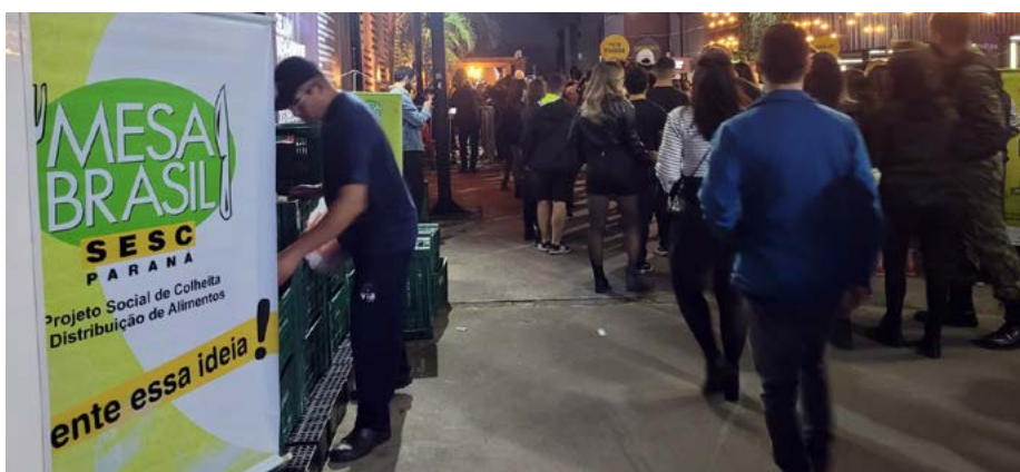
Arrecadação de alimentos no show do NX Zero em Curitiba