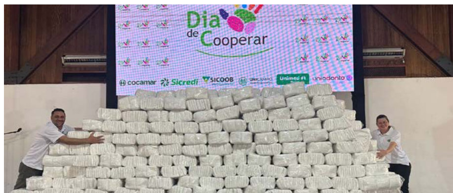
Dia C em Maringá