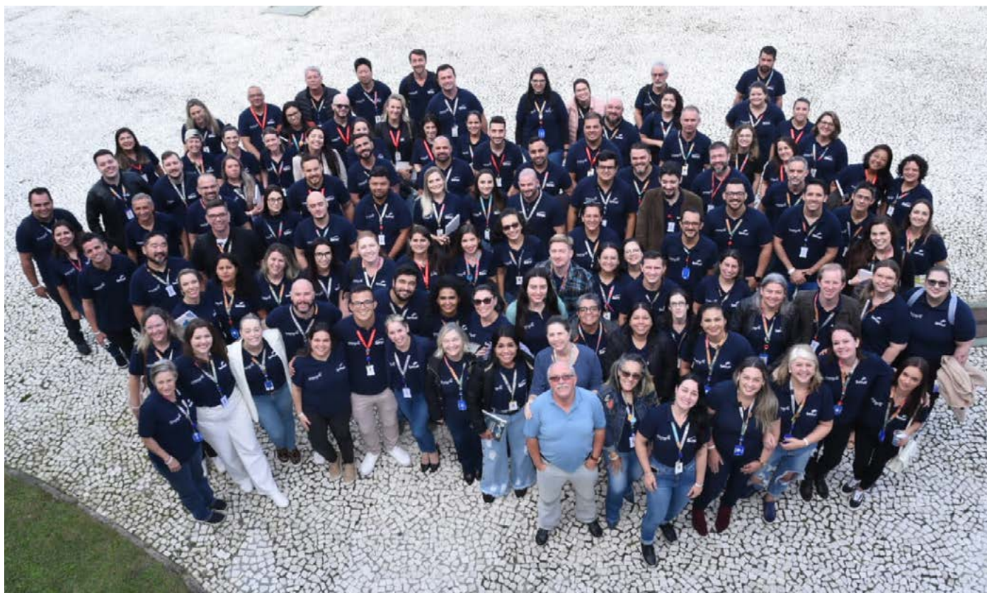
Equipes comerciais do Senac e do Sesc e colaboradores do Núcleo de Comunicação e Marketing (NCM)

Foi finalizado com sucesso o treinamento “Juntos, Encontro de Gestores e Equipe Comercial”, promovido pelo Sesc e Senac, de 26 a 30 de junho, no Hotel Sesc Caiobá. A segunda etapa do treinamento, a partir do dia 28 de junho, reuniu técnicos de relações com o merca-