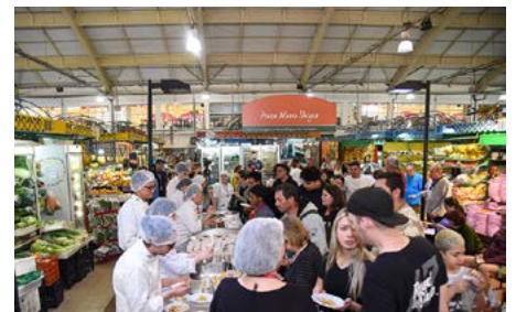
Visitantes do Mercado puderam experimentar os pratos preparados pelos alunos

mentos. Os pratos foram servidos para os visitantes do Mercado Municipal como conscientização da importância do consumo responsável.