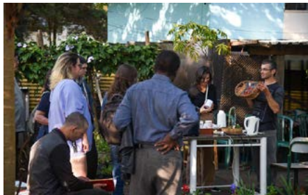
Visita ao projeto Jardim Secreto, uma horta urbana do Colégio Estadual Manoel Ribas

Na quarta-feira (7) eles se reuniram novamente no Mercado para preparar as receitas com os insumos recolhidos. Foram preparados pratos variados com o aproveitamento total dos ali-