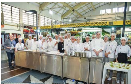
Alunos e professores do curso Tecnólogo em Gastronomia da Faculdade Senac Curitiba Centro