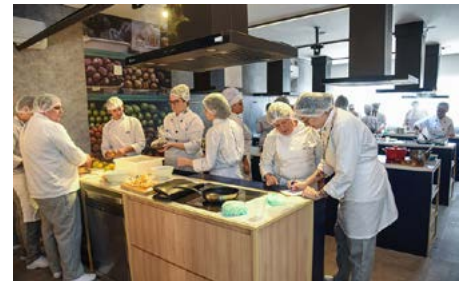
Preparo de pratos com alimentos da xepa do Mercado Municipal de Curitiba