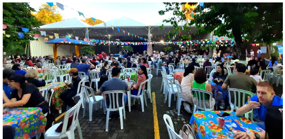
Sesc Foz do Iguaçu