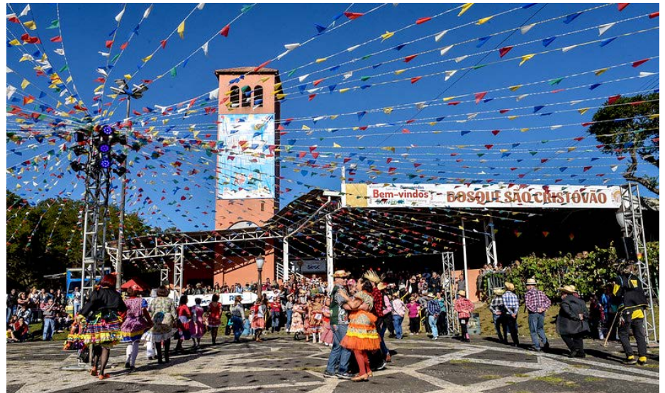
Paraná Junino em Curitiba

ta do Gaúcho da Fronteira; em Londrina Norte o Grupo Herança não deixou ninguém ficar parado; em Caiobá a animação foi com o grupo Garotos de Ouro; e em Paranavaí, que recebeu o Paraná Junino pela primeira vez, o comando do palco foi da Banda Tchê Guri.