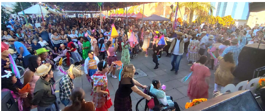
Sesc Londrina Norte