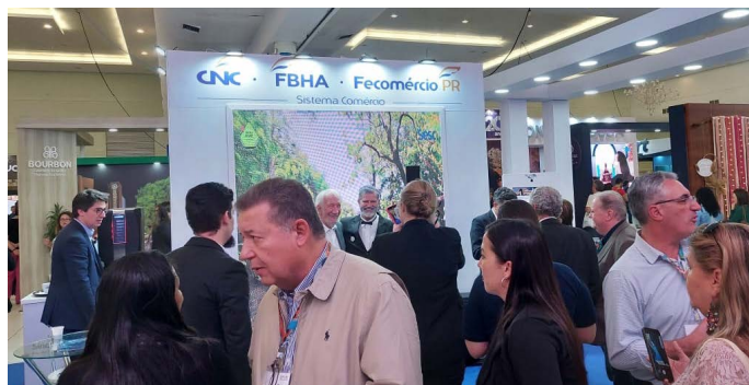
Stand do Sistema Fecomércio Sesc Senac PR e CNC, apoiadoras do Festival das Cataratas

A Feira de Negócios do Festival das Cataratas teve início nesta quinta-feira (1/6), com o corte da fita inaugural. Marcaram presença na solenidade, a ministra do Turismo, Daniela Carneiro; o presidente do Sistema Fecomércio Sesc Senac PR e vice-governador do Paraná, Darci Piana; o presidente da Embratur, Marcelo Freixo; o secretário de Turismo do Paraná, Marcio Nunes; o secretário de Desenvolvimento Sustentável do Paraná, Valdemar Bernardo Jorge; o diretor-geral da Itaipu Binacional, Enio Verri; o prefeito de Foz do Iguaçu, Chico Brasileiro; o organizador do Festival das Cataratas, Paulo Angeli.