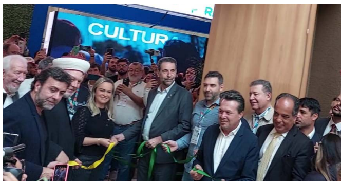
Corte da fita inaugural da Feira de Negócios do Festival das Cataratas