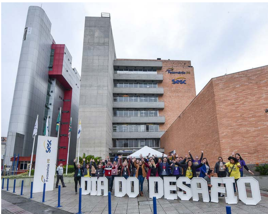
Sesc da Esquina