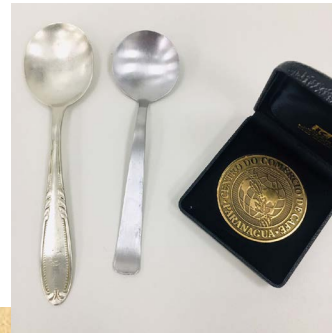
Parte do acervo doado

Para compor o acervo do novo museu, a comunidade local e regional é convidada a doar registros fotográficos, objetos antigos, documentos, notícias, depoimentos e qualquer material que se refira à cultura cafeeira de Londrina e região.