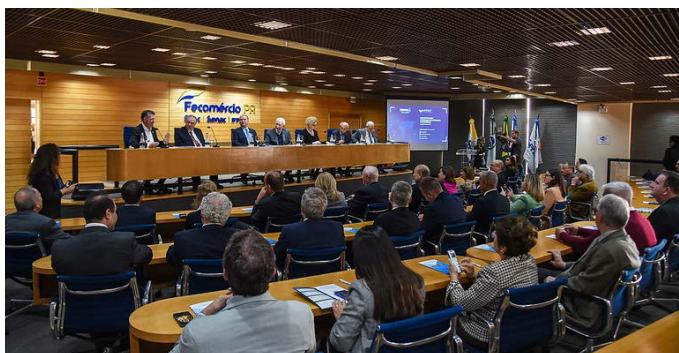
Representantes dos consulados acreditados no Paraná e de Câmaras de Comércio estiveram presentes no encontro

Evento contou com a participação do estado, no intuito de aumentar a sinergia das relações