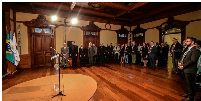
Sesc Paço da Liberdade foi o local escolhido pelo Consulado da Argentina para a comemoração dos 213 da Revolução de Maio em Curitiba

Na última quinta-feira (25), a Fecomércio PR realizou um encontro de consulados e câmara de comércio, em parceria com o estado. O objetivo foi estreitar os laços com os quase 40 consulados acreditados no Paraná e fomentar negócios.