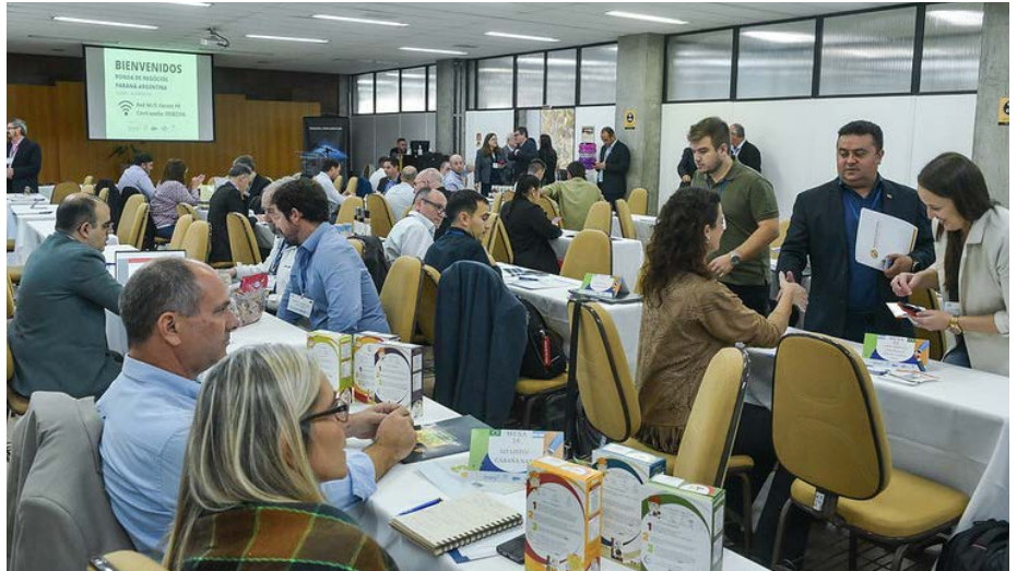
80 empresas participaram das negociações, entre vendedores e compradores