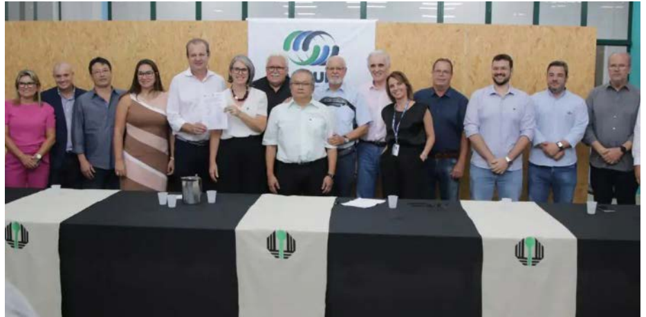
17 membros integram o Comitê Gestor Regional da Ageuni no âmbito da região do Médio Paranapanema.