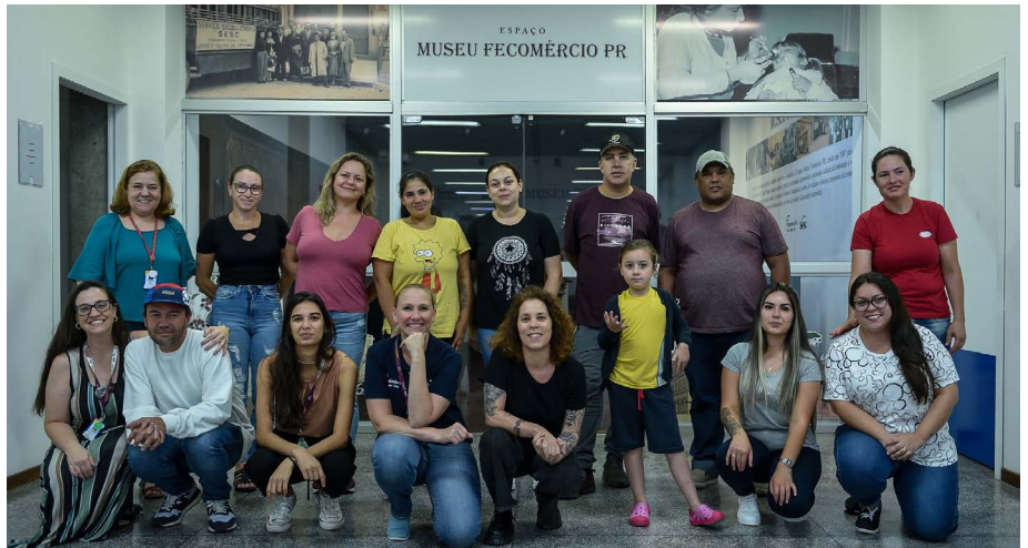
Os alunos do EJA do Sesc da Esquina participaram da oficina

“São 25 anos de audiovisual e oito escrevendo e dirigindo trabalhos próprios: oito curtas metragens e estou ensaiando o meu primeiro longa. O que posso dizer e que escrever é onde tudo começa. Quando comecei a escrever, alguns loucos compraram as minhas ideias, outros me deram prêmios e aí fui fazer cursos de roteiro. Existem sim algumas técnicas, mas muito está dentro da cabeça da gente”, compartilhou a cineasta.