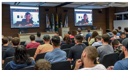
Palestra sobre recrutamento e mercado de trabalho na área de TI para calouros e veteranos da Faculdade Senac Curitiba Portão