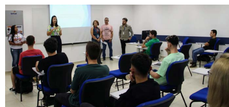
A Faculdade Senac Cascavel deu início a sua primeira turma, de Tecnologia em Análise e Desenvolvimento de Sistemas