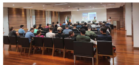
Calouros de Tecnologia em Análise e Desenvolvimento de Sistemas e alunos de Gastronomia da Faculdade Senac Maringá