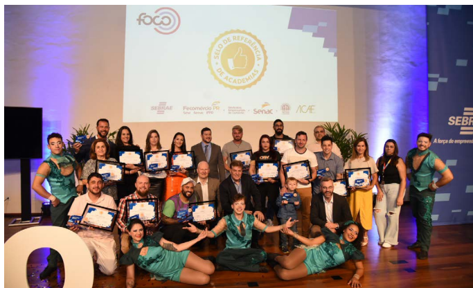
Premiação de academias curitibanas com o Selo de Referência em Atendimento