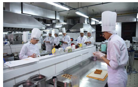
Ocupação de Cozinha