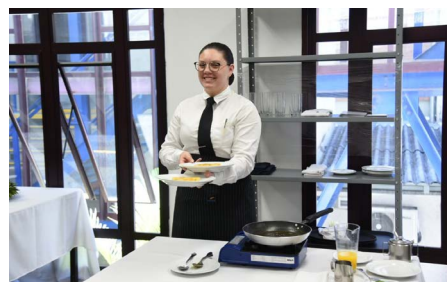
Ocupação de Serviços de Restaurante

A ocupação de Cuidados em Saúde e Apoio Social é a que tem mais competidores disputando a medalha de ouro. As provas da modalidade acontecem de forma individual: os alunos precisaram simular o atendimento de um paciente de esclerose múltipla, em ambiente domiciliar.