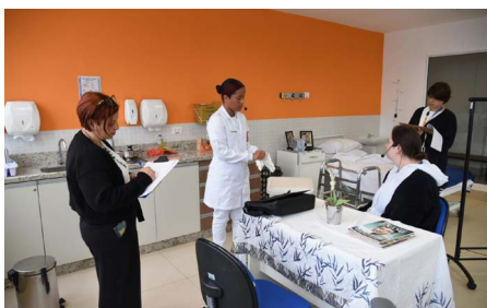
Ocupação de Cuidados em Saúde e Apoio Social