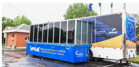
A Unidade Móvel de Pães e Confeitos do Senac PR está instalada na sede administrativa da Prefeitura de Campo Largo