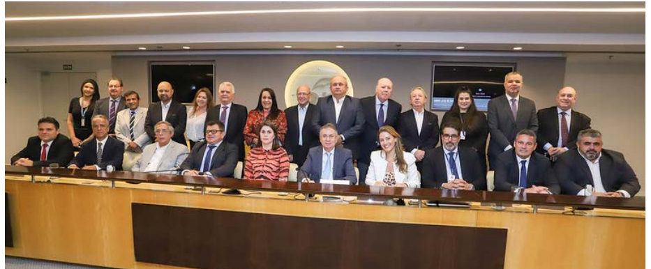
Reunião da Câmara Brasileira do Comércio de Peças e Acessórios para Veículos (CBCPave), realizada na CNC/DF.

O debate ocorreu na reunião da CBCPave realizada de forma híbrida,