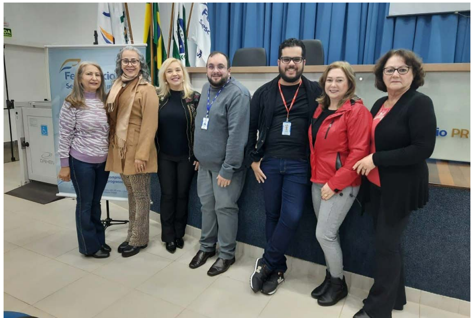
Equipe da CMEG e Senac Campo Mourão durante o workshop

gratuita realizados ao longo do ano foram avaliados positivamente pelos participantes, assim como os conteú-