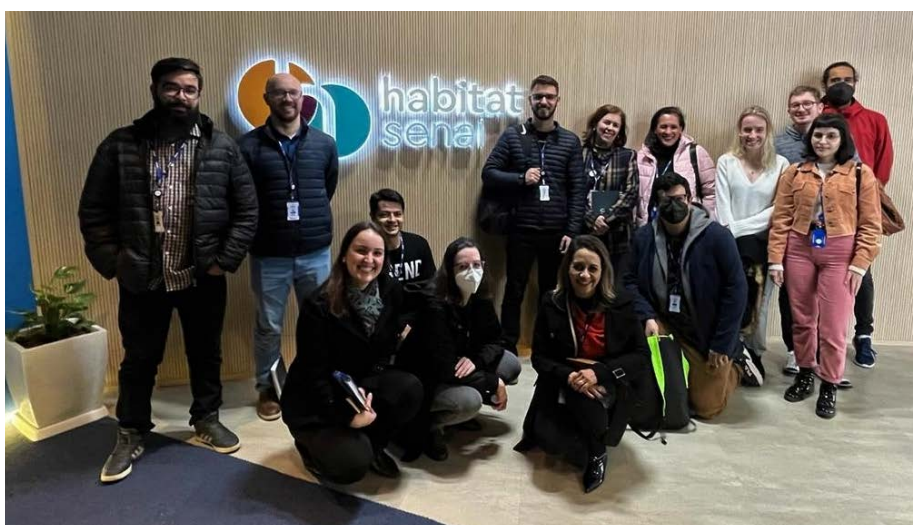
Equipes da Administração Regional durante visita técnica

O local conta com espaços para startups que estão participando