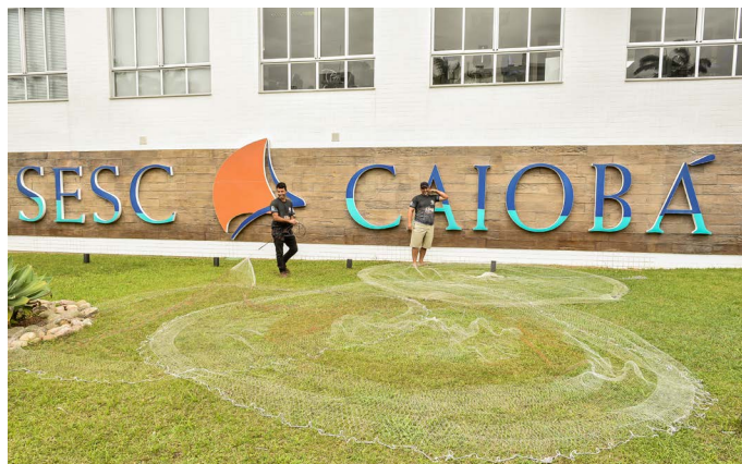
Oficina caiçara: lançamento de tarrafa

As riquezas das diferentes manifestações culturais do Paraná foram celebradas durante a 2ª edição do Festival Sesc de Cultura Popular Paranaense. Integrante do Sesc Regionalidades, o evento foi realizado neste fim de semana, de 19 e 21 de agosto, em Matinhos, com programação cultural e gastronômica voltada para a comunidade e aos hóspedes do Hotel Sesc Caiobá.