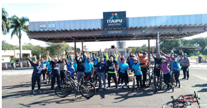
Foz do Iguaçu