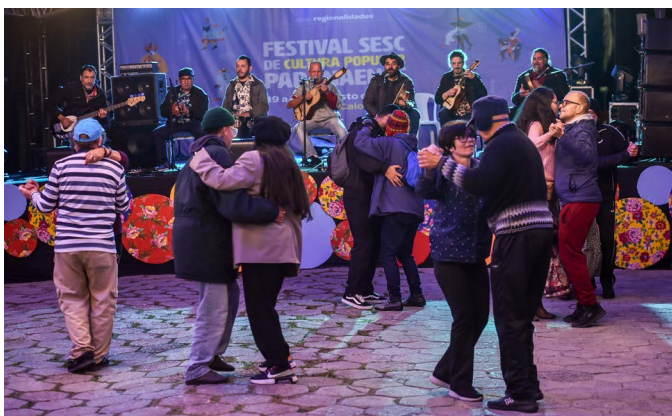
Baile de fandango