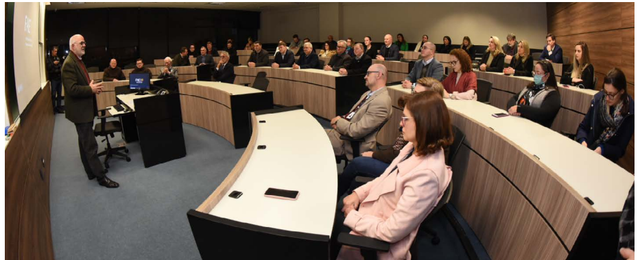
Cerimônia de lançamento do projeto Consultoria Solidária aconteceu na FAE Business School

O Projeto idealizado pela FAE em parceria com a Fecomércio PR e Sebrae/PR tem como objetivo levar consultoria gratuita de gestão aos empreendedores do comércio para melhorarem os resultados de seus negócios.