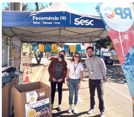
Ação RPC Campanha do agasalho Londrina