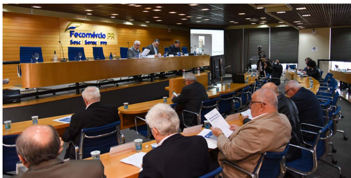
Reunião do Conselho Regional do Sesc PR