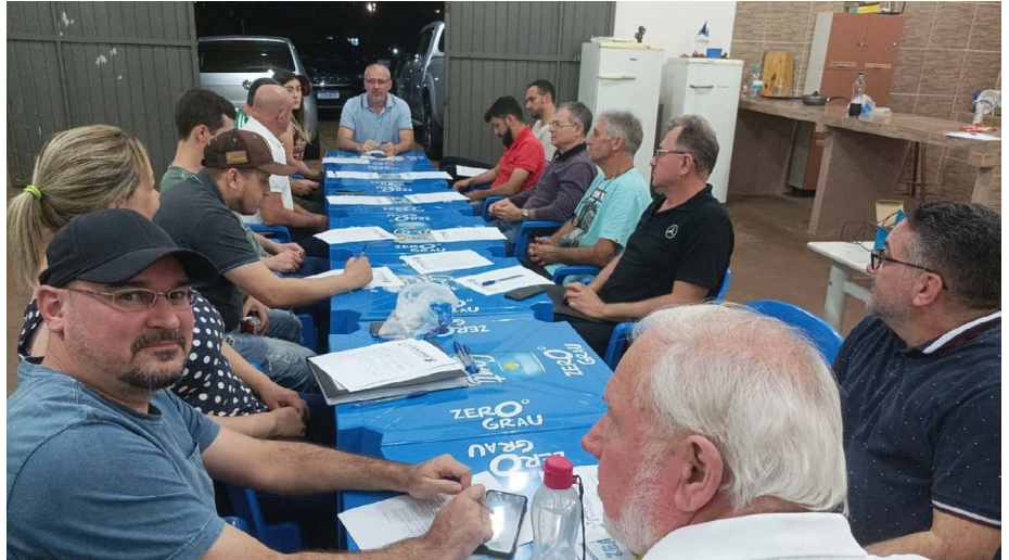
Comissão organizadora do evento

O tradicional evento esportivo contábil tem como objetivo incentivar a prática de esportes e promover a integração entre a categoria. Delegações dos 17 sindicatos de contabilistas do Paraná estarão em Campo Mourão para disputar a competição que acontece anualmente. É esperada a participação de cerca de 600 contadores e técnicos de contabilidade oriundos de todas as regiões do estado na competição, que nos últimos dois anos não foi realizada devido à pandemia de Covid-19.