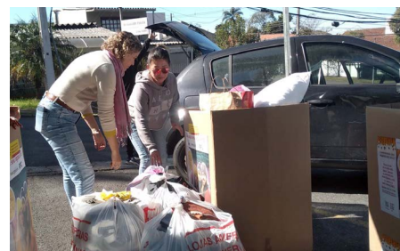
Ação RPC Campanha do agasalho Curitiba

O Sesc PR, a RPC e o Instituto GRPCOM realizaram uma ação conjunta no sábado (30) para intensificar as doações para a 14ª edição da Campanha do Agasalho. Emissoras da RPC em todo o estado, receberam peças de agasalhos, calçados e cobertores no sistema de drive thru.