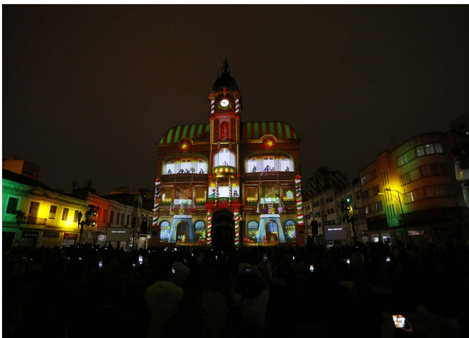
Registro da projeção mapeada do Natal no Paço em 2019

O evento é uma realização da Labirinto Produções com apoio cultural do Sistema Fecomércio Sesc Senac PR.