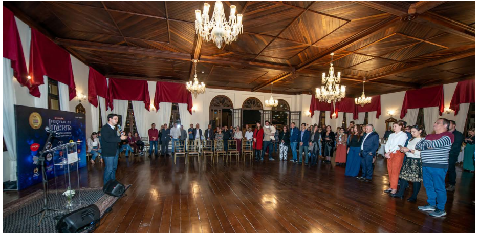
O vice-prefeito de Curitiba, Eduardo Pimentel durante o evento de lançamento do Festival

De acordo com Jorge Tonatto, presidente da Rede Empresarial do Centro Histórico, organizadora do evento, o Festival de Inverno proporciona aos visitantes vivenciar a região de um modo especial, com atrações culturais para todas as idades e valorização da identidade curitibana no inverno. “É com muita alegria que celebramos os 10 anos da nossa Rede com o retorno do Festival de Inverno ao formato presencial. Nossa região concentra um complexo arquitetônico muito importante para a memória da cidade e é uma oportunidade para que todos co-