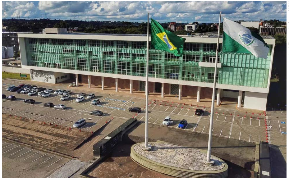
Palácio Iguazu, em Curitiba

“Estamos acompanhando a lei federal, que foi votada pelo Congresso Nacional. Mesmo com a redução da arrecadação dos estados e municípios, entendemos que é necessário