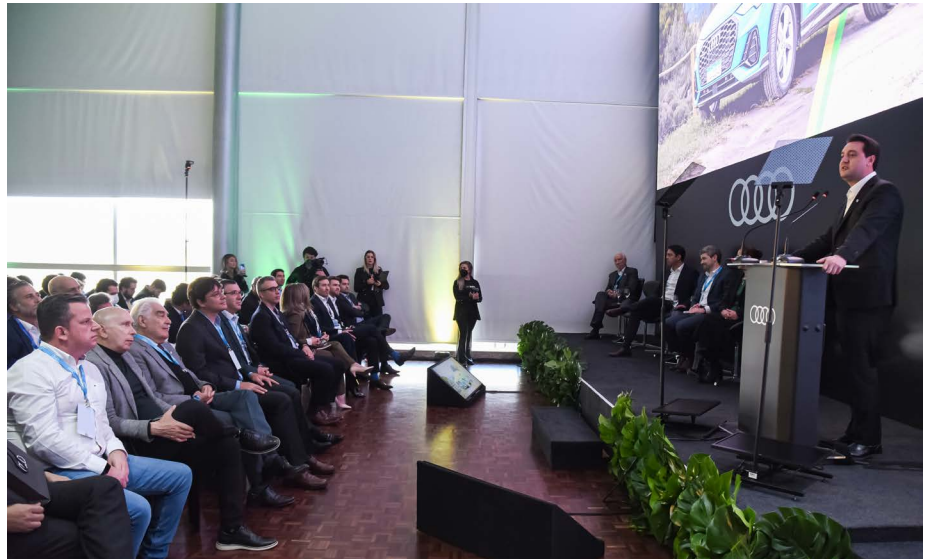
O governador Carlos Massa Ratinho Junior discursou e falou sobre os investimentos e geração de emprego

“Estamos nos transformando na central logística da América do Sul. Atraímos R$120 milhões em investimentos da iniciativa privada e geramos 75 mil empregos nos últimos cinco meses. Isso é fruto de um trabalho estratégico desenvolvido por nossa equipe. Queremos atrair empresas que gerem emprego com