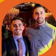
Palestrante Maringá Gastronômica