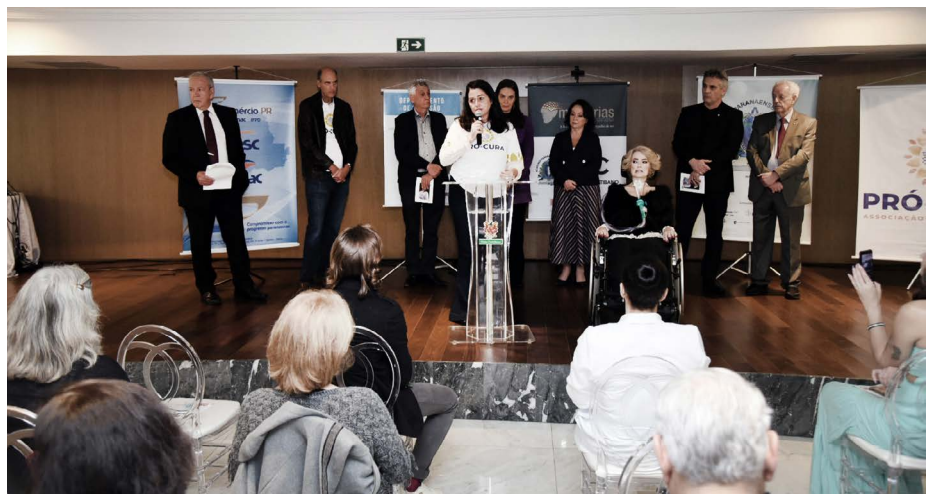
Lançamento do livro “A Vida é Bela”

O livro relata a trajetória da autora desde que foi diagnosticada com Esclerose Lateral Amiotrófica (ELA). A renda será revertida para a Associação Pró-Cura da ELA. A publicação conta com o apoio da Fecomércio PR.