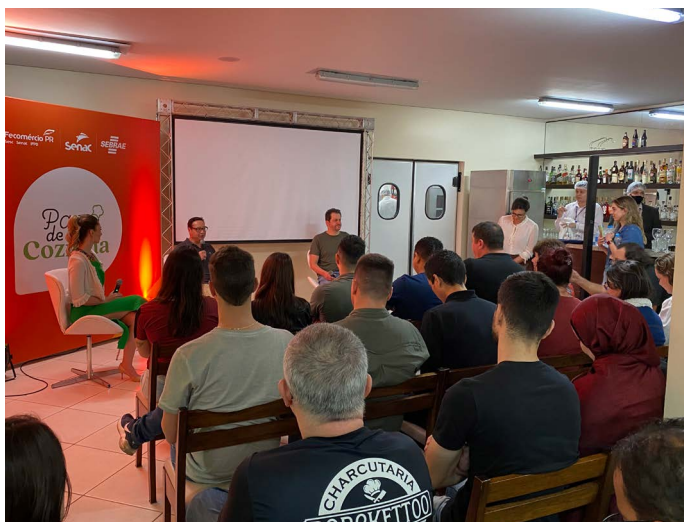
Papo de Cozinha reuniu mais de 50 convidados no Senac Cataratas