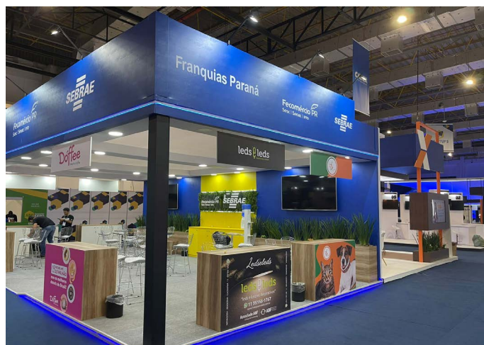
Estande das franquias paranaenses no espaço do Sebrae Paraná e Fecomércio PR na ABF Franchising Expo

Com o objetivo de ampliar mercado para franqueadoras paranaenses, desenvolver parcerias e proporcionar conexões, o Sebrae Paraná e a Fecomércio PR marcarão presença na ABF Franchising Expo, considerada a maior feira do setor de franquias da América Latina. No estande, que será aberto para visitaç o entre os dias 22