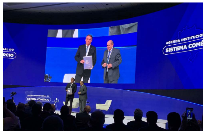
O presidente da CNC, José Roberto Tadros, entregou a Agenda Institucional do Sistema Comércio ao presidente da República, Jair Messias Bolsonaro

Nos dias 22 e 23 de junho, a Confederação Nacional do Comércio de Bens, Serviços e Turismo (CNC) apresentará, em Brasília, o documento com proposições para o desenvolvimento dos setores representados no encontro de lançamento da Agenda Institucional do Sistema Comércio – Propostas e Recomendações de Políticas Públicas do Comércio de Bens, Serviços e Turismo.