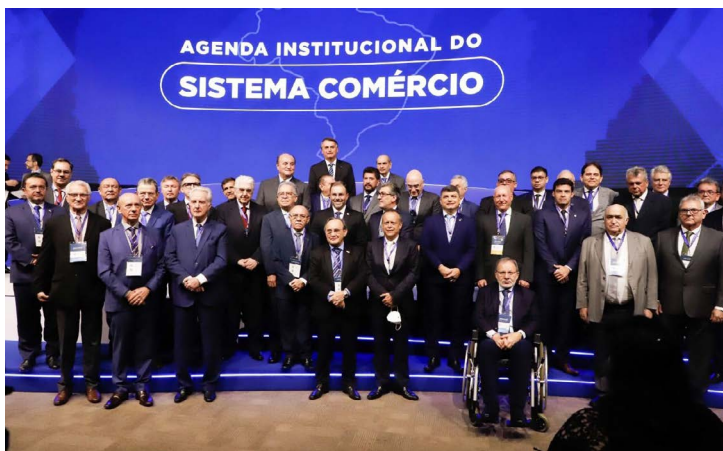
Presidentes de federações presentes e diretores da CNC com o presidente Bolsonaro