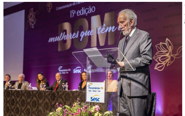
O vice-governador, Darci Piana durante seu discurso

Essa edição do Prêmio Mulher Empreendedora trouxe como tema “Mulheres que tem o dom”, homenageando empresárias que se destacaram no setor do comércio de bens, serviços e turismo do estado. “As mulheres exercem seu protagonismo em vários setores, são capazes de gerir empreendimentos de alta complexidade. Mesmo com a pandemia elas se mantiveram firmes, se reinventaram e atravessaram esse momento turbulento. Preciso lembrar que a união entre as 22 câmaras fez muita diferença, juntas pensamos