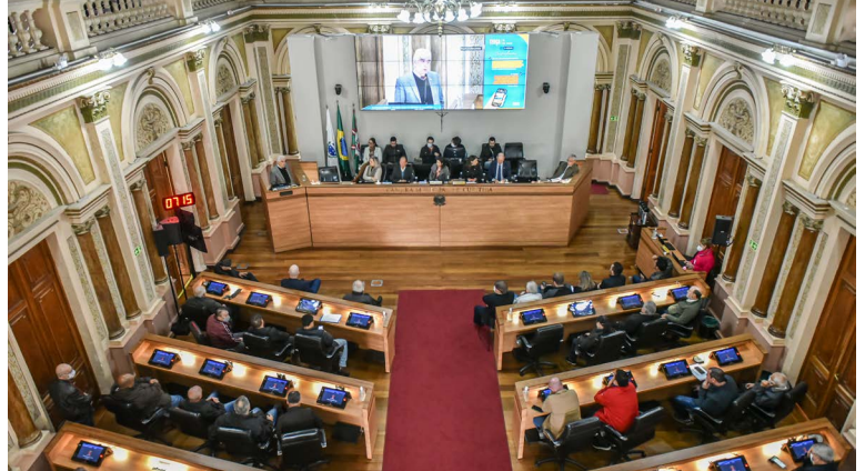
Representantes dos empresários e trabalhadores do comércio debateram sobre os pontos e contrapontos do PL