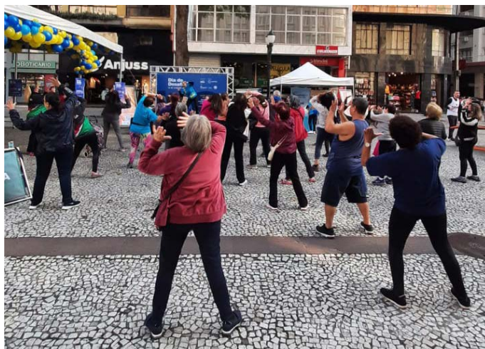
Dia do Desafio na Boca Maldita, em Curitiba

durante o dia e atividades especiais na academia. A programação ainda conta com o Baile Especial do Desafio, às 15h, no salão social.