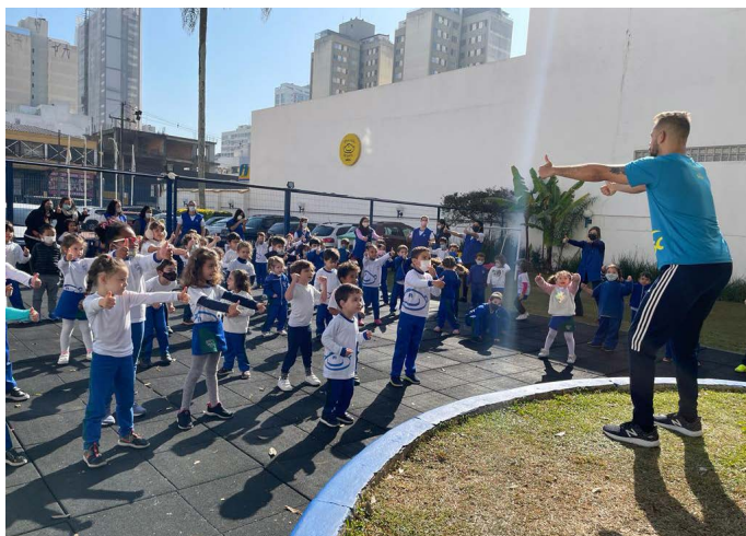
Dia do Desafio no Sesc Educação Infantil