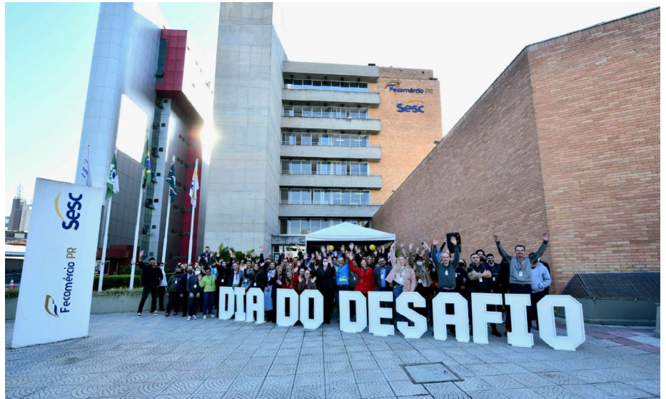
Sesc da Esquina terá atividades até o final do dia

Rua XV de Novembro: Em parceria com a Prefeitura de Curitiba, o Sesc PR realizará uma série de atividades gratuitas na Boca Maldita, das 9h às 17h, incluindo: simuladores eletrônicos, tênis de mesa, xadrez gigante, atividades recreativas para crianças (jogos e cama elástica), cabine de fotos, além de atividades de palco e aulas de ginástica promovidos pela prefeitura. O Sesc PR também oferecerá orientações de saúde e avaliação física no local.