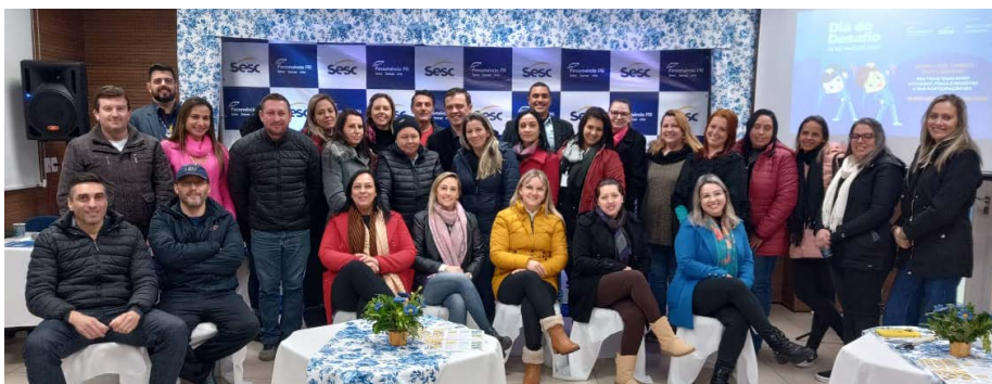
Lançamento do Dia do Desafio em União da Vitória