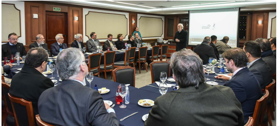
O presidente do Sistema Fecomércio Sesc Senac PR, Darci Piana, durante o almoço de cortesia servido no restaurante-escola

O Restaurante-escola do Senac Curitiba Centro recebeu magistrados e servidores do Conselho Nacional de Justiça (CNJ) em um almoço de cortesia na quarta-feira (18). O grupo acompanhado pela 2ª vice-presidente do Tribunal de Justiça do Estado do Paraná, Desembargadora Joeci Machado Camargo, e recebido pelo presidente do Sistema Fecomércio Sesc Senac PR e vice-governador do estado, Darci Piana, e o diretor regional do Sesc PR, Emerson Sextos.