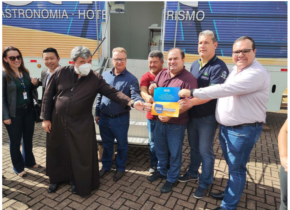
Entrega da chave simbólica da Unidade Móvel de Turismo e Gastronomia do Senac PR em Borrazópolis