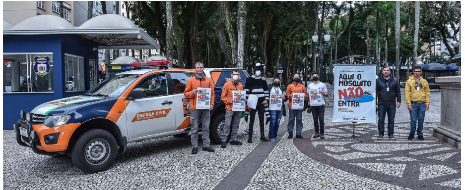
Equipe da ação formada por representantes do Sesc da Esquina, Sesa e Defesa Civil

Mobilizar a população para combater a dengue foi o objetivo da ação da Campanha Aqui o Mosquito Não Entra realizada na manhã de terça-feira, 10, na Boca Maldita, pelo Sesc da Esquina, Defesa Civil e Secretaria de Estado da Saúde (Sesa). Os transeuntes eram abordados pelos representantes das três instituições e também por um animador, vestido de mosquito Aedes aegypti, transmissor da doença.