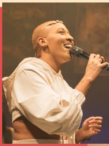
Kimani (São Paulo - SP)