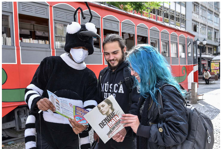
Animador aborda transeuntes na Boca Maldita

Com números em crescimento, a população é a grande aliada da campanha que conta com aplicativo do Sesc para registrar focos de criadouros do mosquito eliminados e também participar do jogo interativo. “A Sesa valoriza muito este tipo de ação, que visa levar informação e orientação para que as pessoas cuidem dos seus imóveis, identifiquem os criadouros da dengue, perceba que também é responsável assim como o setor público. Este período epide-