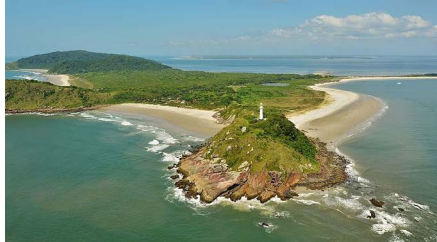
Ilha do Mel, Paranaguá