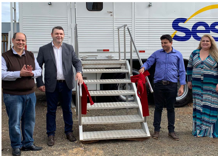
As autoridades em frente à unidade móvel do OdontoSesc, instalada na Av. Prefeito Moacir Costa, 460

A cidade de Japira, localizada no Norte pioneiro do estado, foi o primeiro município a ser contemplado pela unidade móvel do OdontoSesc em 2020. Com a pandemia de Covid-19 os atendimentos foram suspensos em detrimento dos decretos sanitários vigentes.