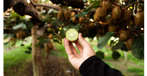
Chácara Kiwi, em Balsa Nova

Uma das principais datas comemorativas no Brasil é o Dia das Mães. Além de movimentar o comércio em busca de presentes, a data também movimenta o setor turístico que enxerga nos pacotes de viagens uma opção para presentear as mães. Neste final de semana, o Sesc Paraná vai movimentar dezenas de pessoas em quatro opções diferentes de viagens, três deles para destinos paranaenses.