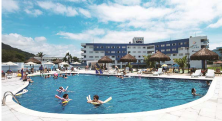
Sesc Caiobá, em Matinhos