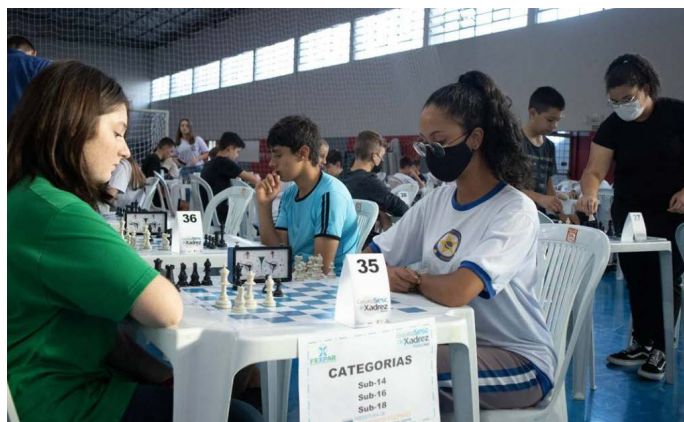
Circuito Sesc de Xadrez em Francisco Beltrão

Mais de 250 enxadristas participaram das últimas duas etapas do Circuito Sesc de Xadrez nas cidades de Medianeira e Francisco Beltrão, no dia 9 de abril. Além dos atletas das cidades-sede, participaram também atletas de cidades vizinhas, movimentando as regiões do entorno. Realizado pelo Sesc Paraná com apoio técnico da Federação de Xadrez do Paraná (Fexpar), o Circuito tem a finalidade de aliar educação e lazer ao promover o intercâmbio sociocultural e desportivo entre os participantes.