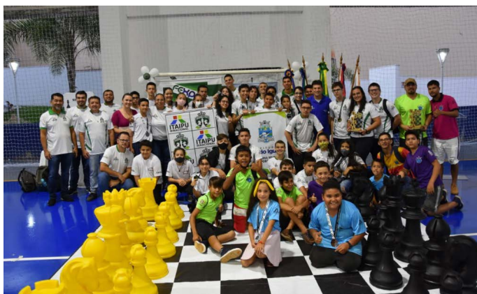
Circuito Sesc de Xadrez em Medianeira