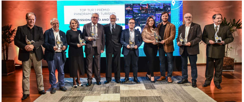
Representantes das entidades parceiras do prêmio também foram agraciados

A Fecomércio PR esteve presente na entrega do Top Tur | Prêmio Panorama do Turismo | Profissionais do ano | 2021, que aconteceu no auditório do Sebrae PR na terça-feira (12).