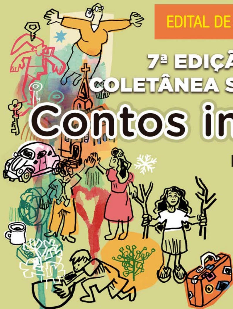
Ilustração: Fabiano Vianna