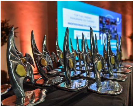
Troféu Top Tur | Prêmio Panorama do Turismo | Profissionais do ano | 2021

Personalidades do turismo paranaense receberam o prêmio nesta terça-feira