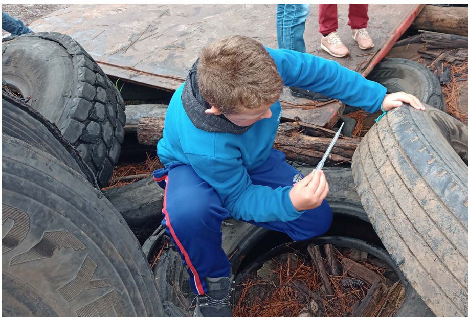
Ação realizada pelo Sesc União da Vitória com alunos de escolas municipais

Também foi realizada uma caça aos focos da dengue, com a captura de possíveis larvas do mosquito através de um cenário com pneus organizado pela equipe dos agentes de endemias, garantindo a segurança de todos os participantes.