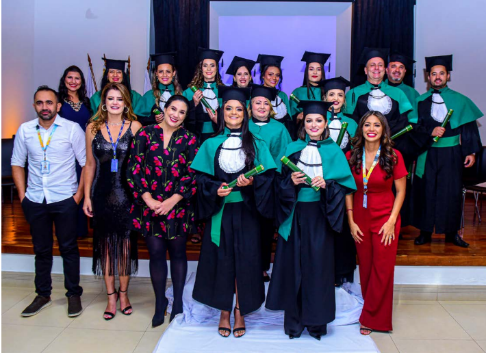
Os formandos da turma do curso Técnico em Radiologia do Senac Ivaiporã