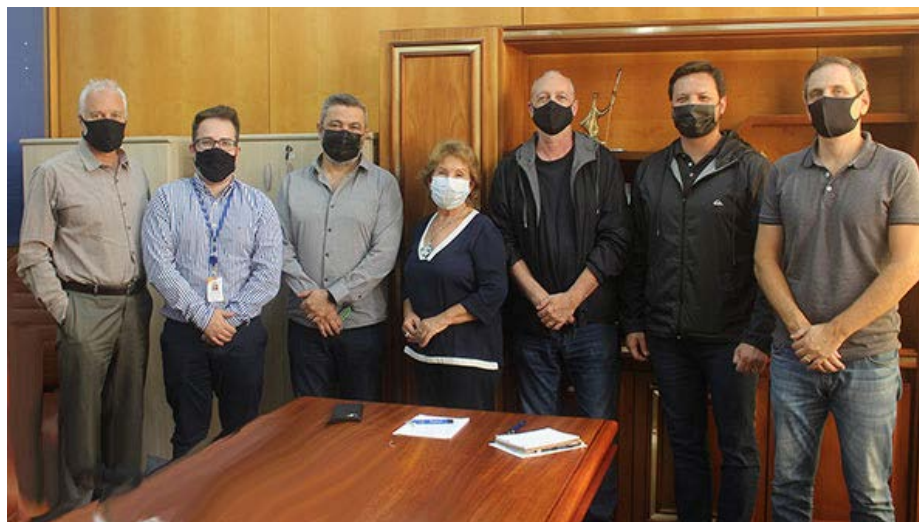
Os membros da comissão de homologação, na reunião na Fecomércio PR

A entrega dos troféus aos eleitos acontecerá no dia 12 de abril, em Curitiba, em evento a ser organizado pela empresa Mark Messe e patrocina-