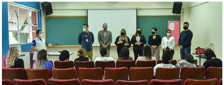
Abertura do curso de Manicure e Pedicure na Fundação Weiss Scarpa

“É um grupo seleta, escolhidas a dedo para um curso que precisa de dedicação, gerando autonomia e emancipação da mulher. O curso